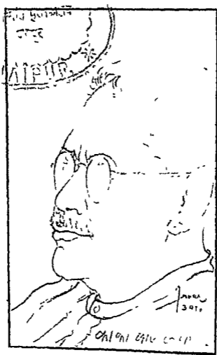
श्री काका कालेलकर